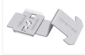
Clip Fijación Rail