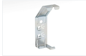
Soporte ligero techo